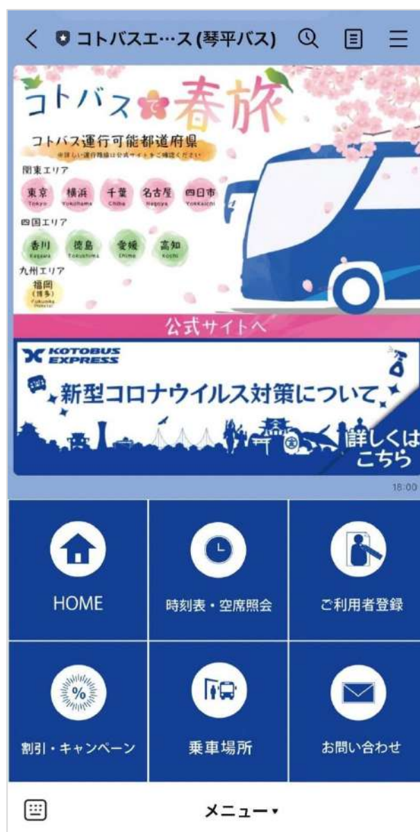
▲リッチメッセージの上半分は配信ごとに訴求内容を変え、下半分は新型コロナウイルスの対策を案内

今後、琴平バスではLINE公式アカウントの友だち数をさらに集め、配信効果を高めるためにセグメント配信の検証も行っていきたいといひます。